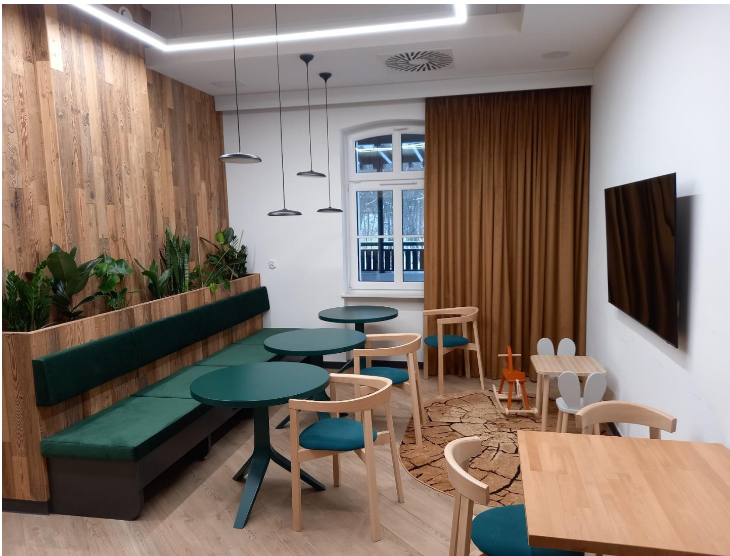
Sala gastronomiczna (pow. łączna 83,03 m 2 ) – oznaczona w załączniku nr 1 kolorem zielonym Sala eksp. – Pusz. Bukowa (pow. 22,53 m 2 )