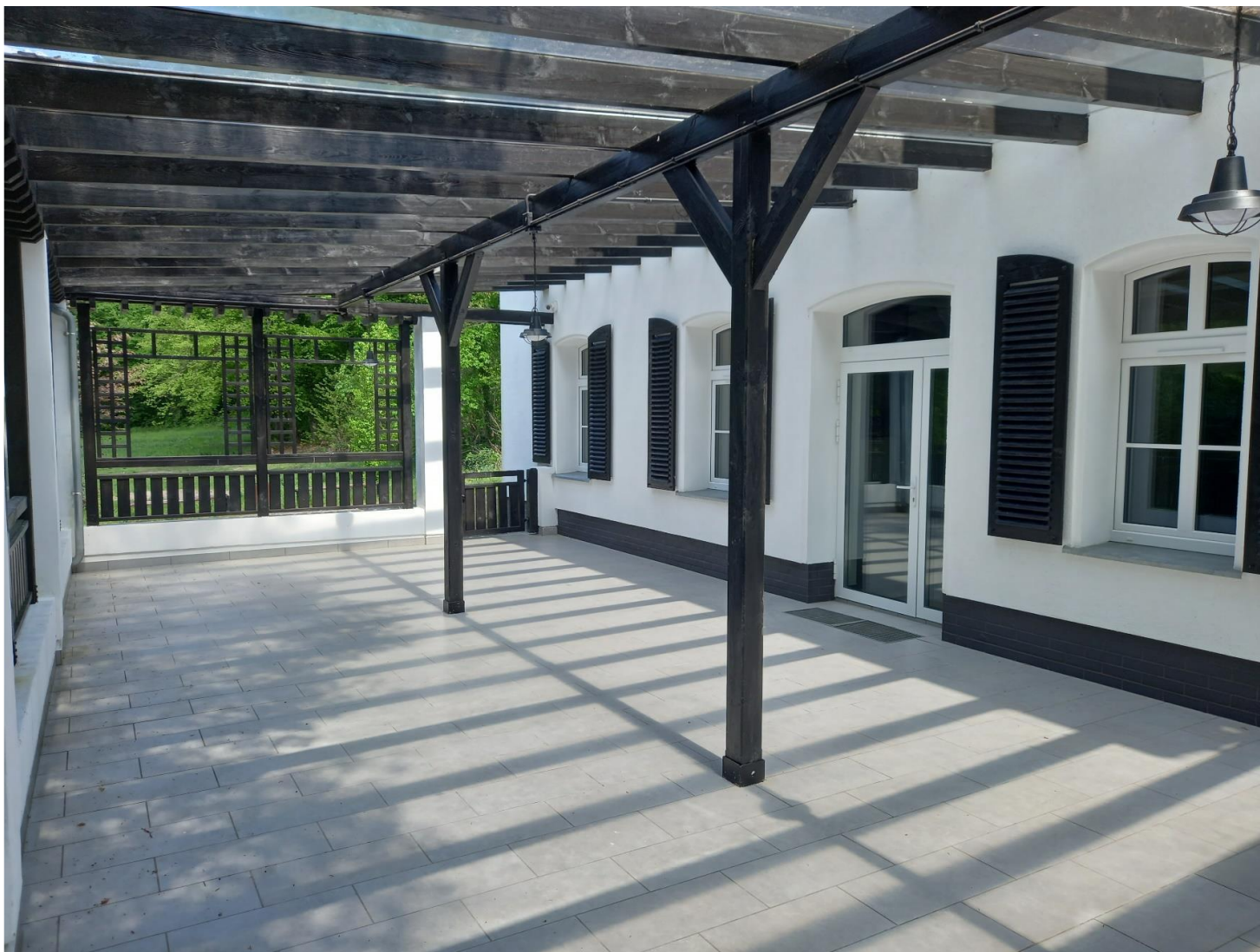
(na powyższym zdjęciu widoczne w głębi wejście na taras od tyłu budynku – jeden z możliwych ciągów dla zaopatrzenia)