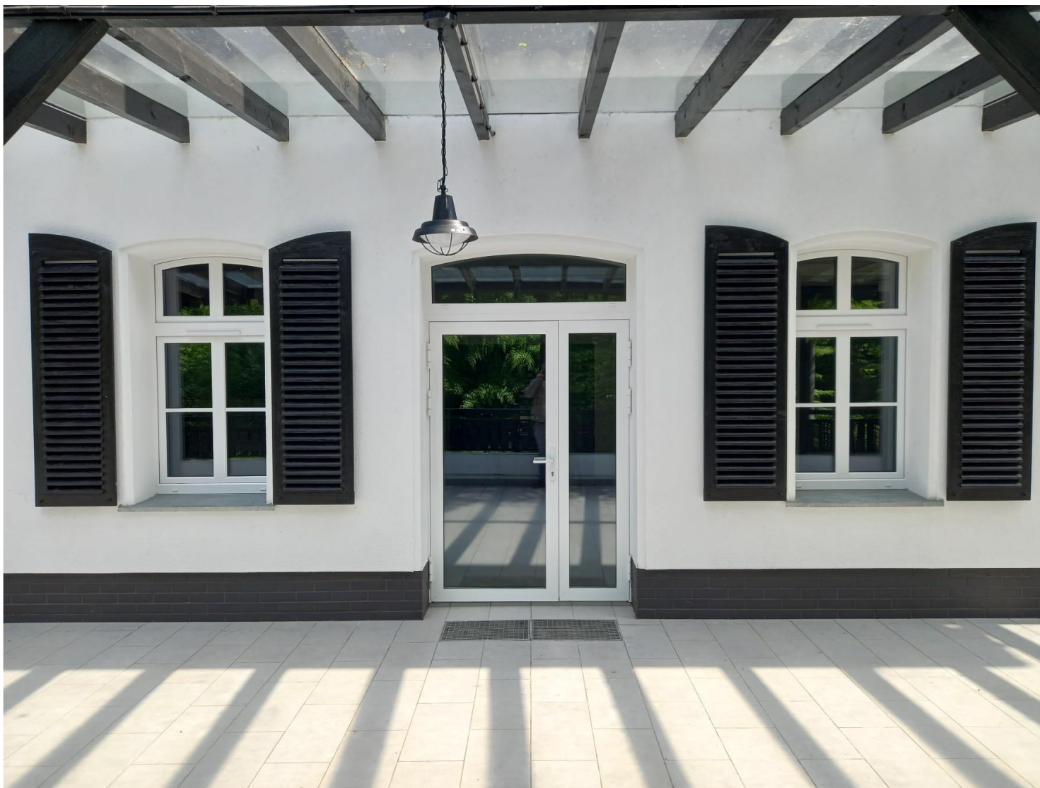
(powyższe zdjęcie przedstawia przejście z tarasu letniego do sali gastronomicznej, stanowiące wejście do planowanego lokalu)