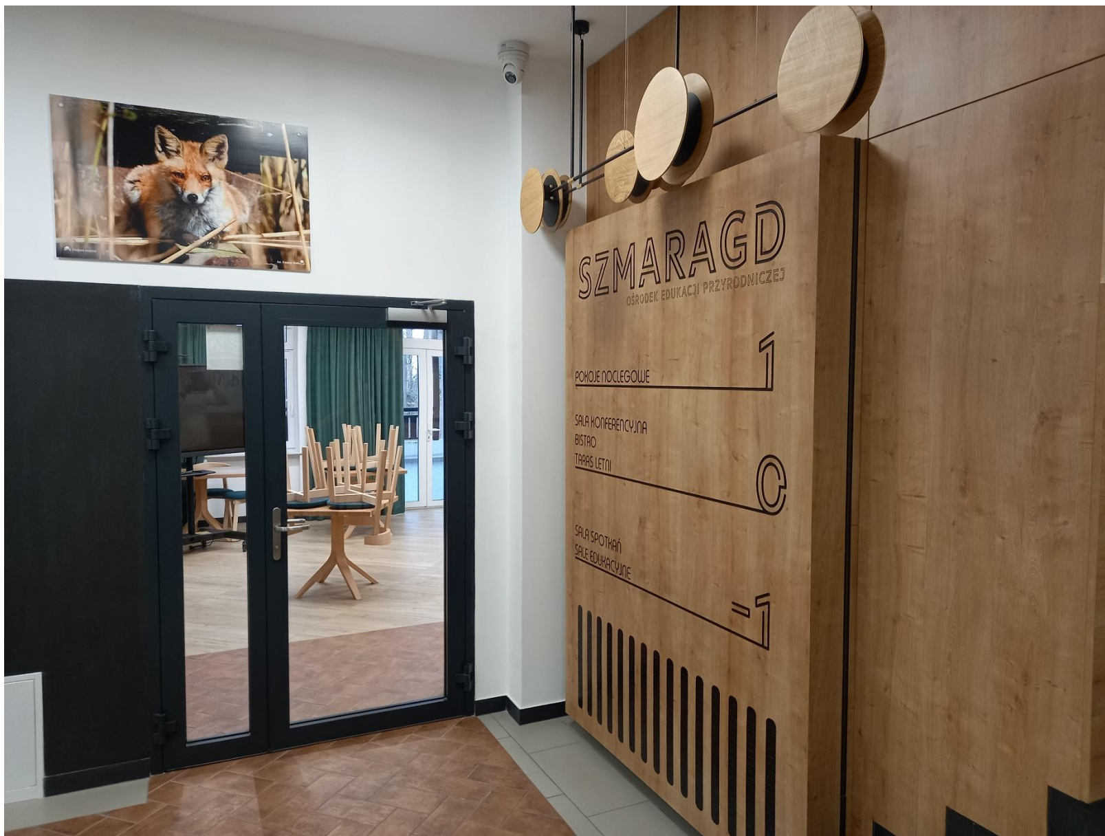
Powyższe zdjęcie przedstawia hol budynku. Na wprost wejście z holu do sal gastronomicznych oznaczonych na planie kolorem zielonym , za plecami przejście do toalet oznaczonych na planie kolorem fioletowym