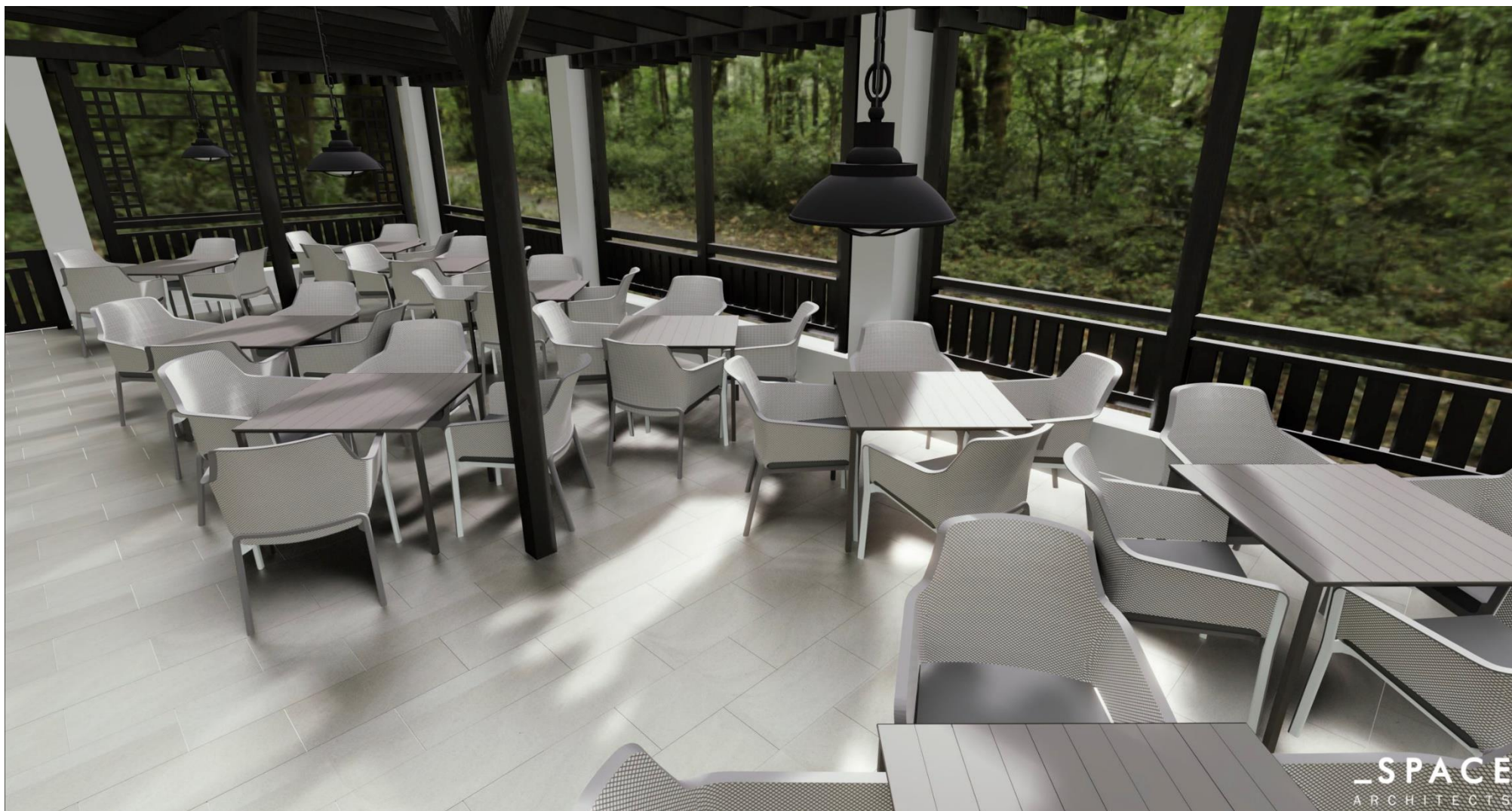
(powyższa wizualizacja przedstawia widok tarasu letniego)