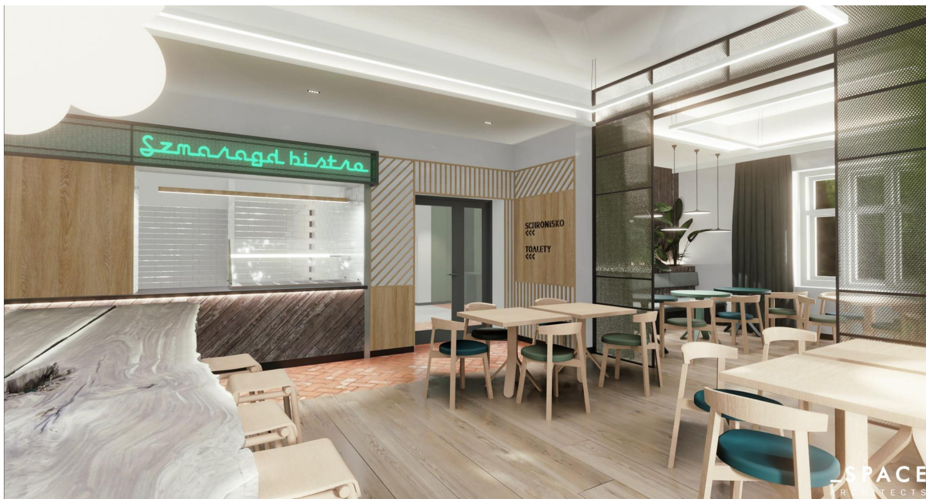
(powyższa wizualizacja przedstawia wnętrze pomieszczenia oznaczone w zał. nr 1 jako 'Sala eksp. -konferencyjna')