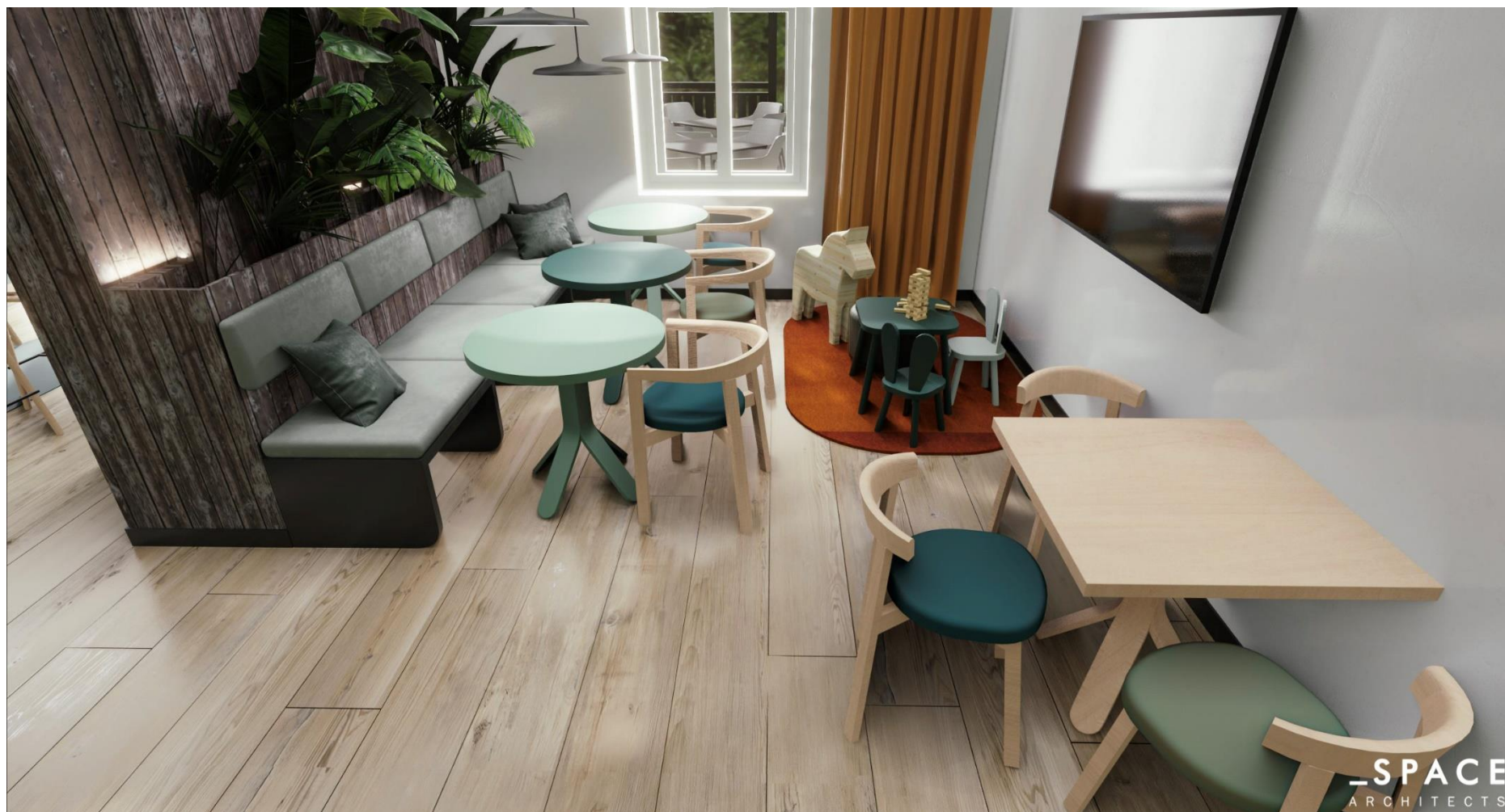
(powyższa wizualizacja przedstawia wnętrze pomieszczenia oznaczone w zał. nr 1 jako 'sala eksp. Puszcza Bukowa')