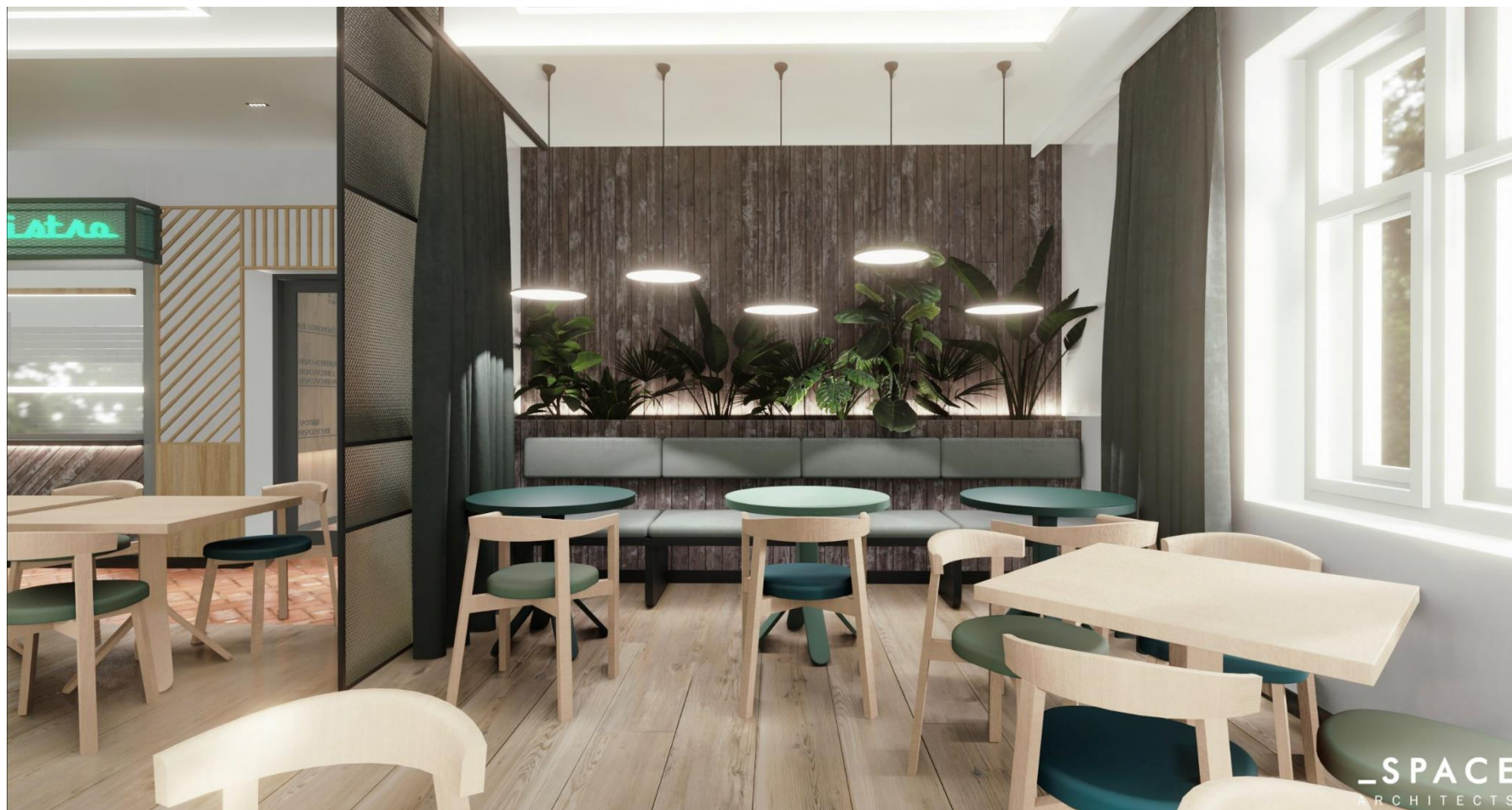
(powyższa wizualizacja przedstawia wnętrze oznaczone w zał. nr 1 jako 'sala eksp. J.Szmaragdowe')