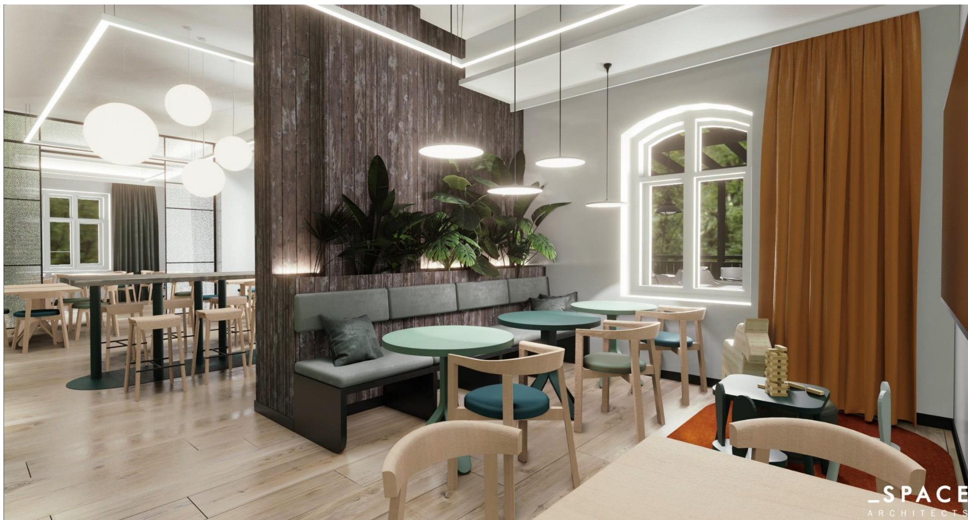
(powyższa wizualizacja przedstawia wnętrze pomieszczenia oznaczone w zał. nr 1 jako 'sala eksp. Puszcza Bukowa', w głębi po lewej pozostałe dwie sale)