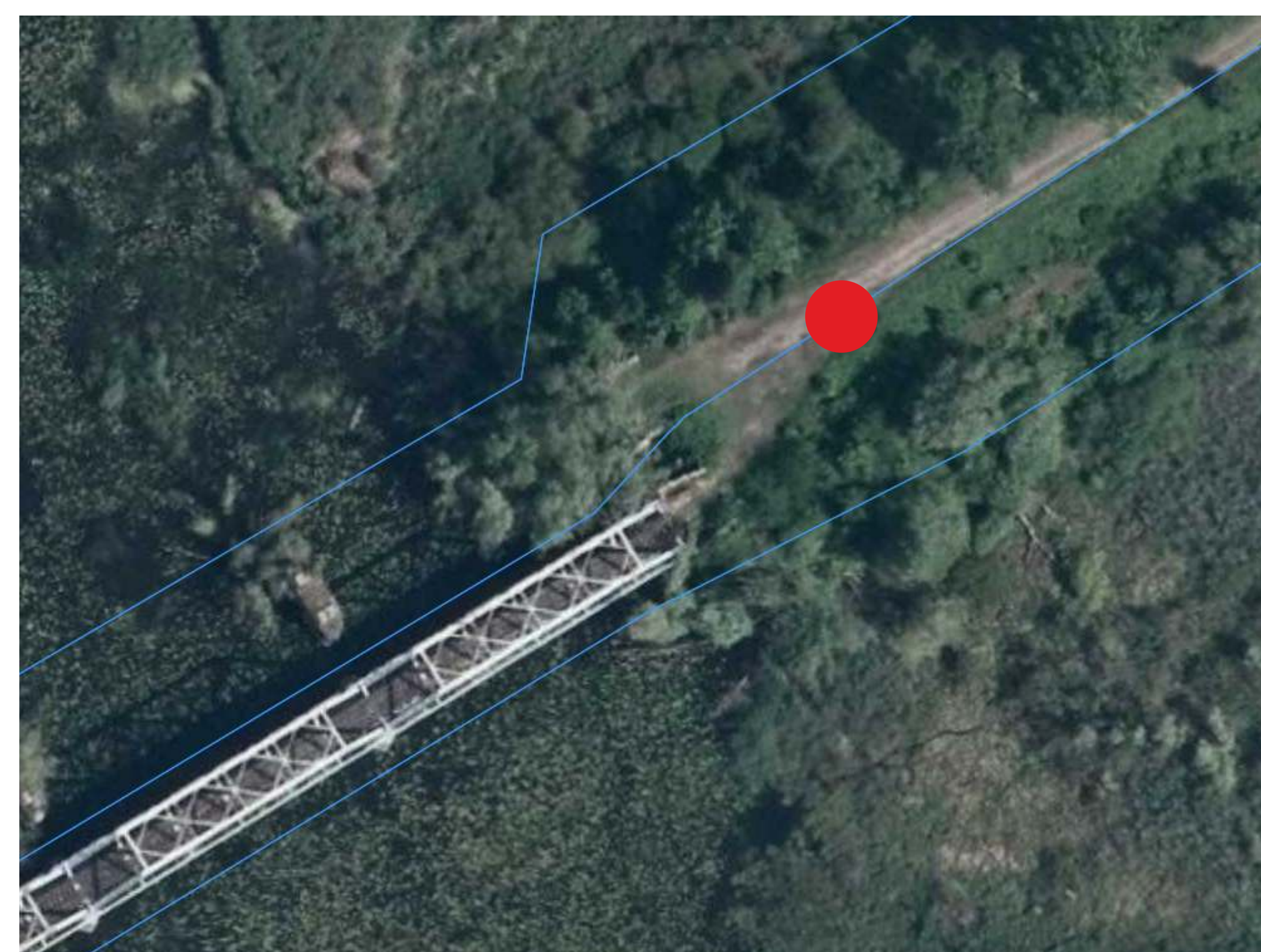
Lokalizacja tablicy tymczasowej

Projekt dofinansowany przez Unię Europejską ze środków Europejskiego Funduszu Rozwoju Regionalnego