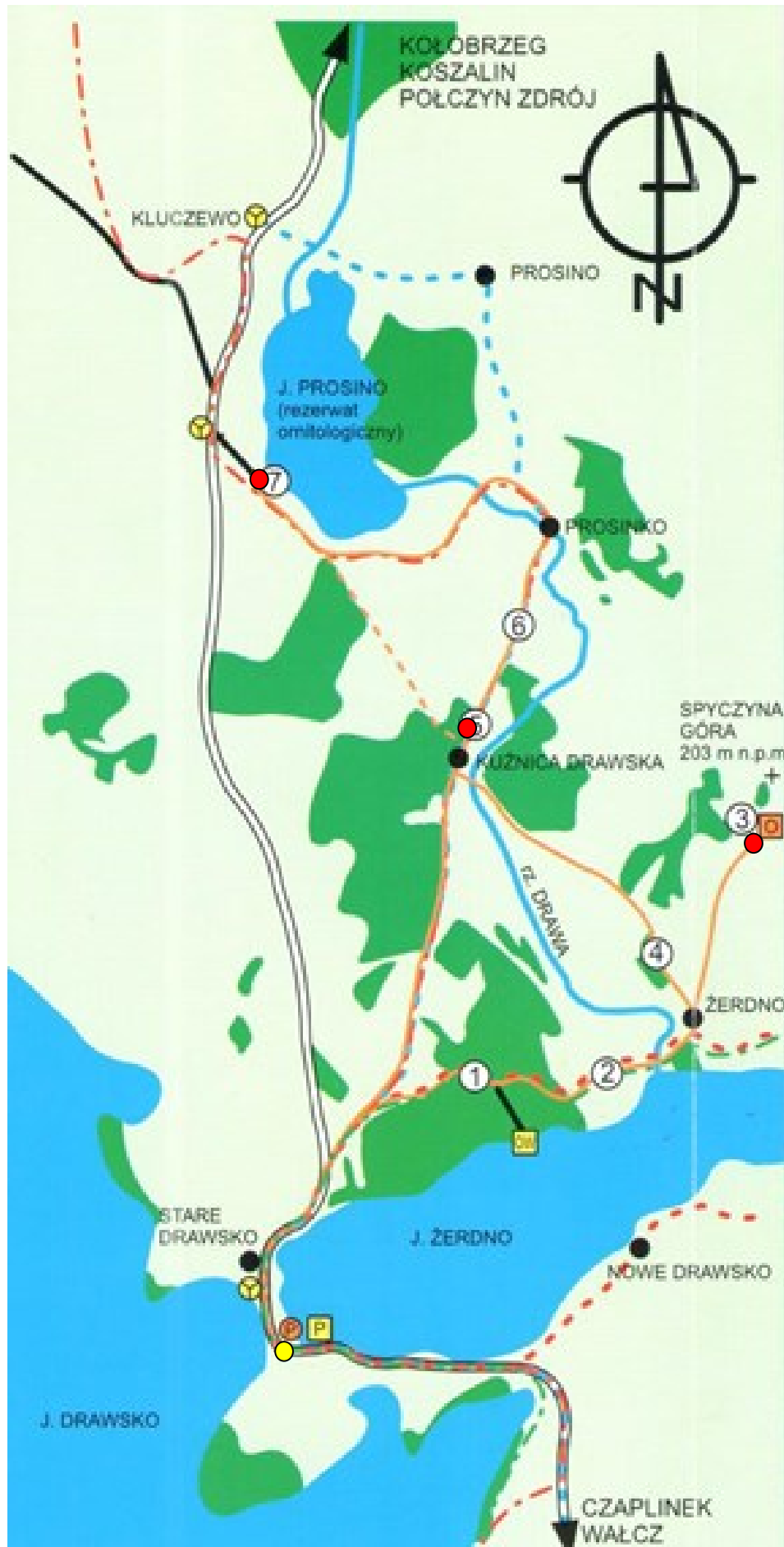
Załącznik 2. Proponowana lokalizacja oznakowania ścieżki turystyczno – edukacyjnej Jezioro Prosino – Spyczyzna Góra.